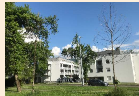
Les deux chênes plantés aux Archives n'ont pas survécu

Pourtant, en milieu urbain, l'espérance de vie d'un arbre est fortement réduite et dépasse rarement quelques décennies. Un arbre planté dans un sol tassé, pavé, sans place suffisante pour ses racines pousse deux fois moins vite. Voilà pourquoi il faut, en priorité, chercher à préserver les arbres existants plutôt que d'en planter des nouveaux avec des résultats incertains à long terme.