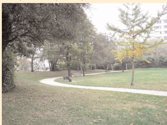
Parc des Aiguinards

2. Les projets piscine / petite enfance doivent être dissociés tout en étant envisagés dans une logique globale d'aménagement du quartier et doivent faire l'objet de deux cahiers des charges séparés.